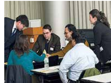
ALT指導力等向上研修会 「言語活動における指示についてのワークショップ」