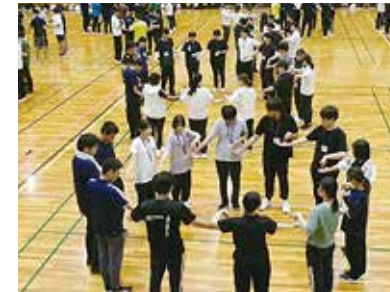
若手教員研修（初任者研修会） 「チーム育成力向上研修」