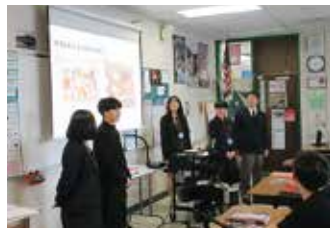
シェルドン高校での交流活動