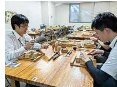
中堅教諭等資質向上研修 （社会体験研修）