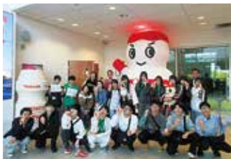
ヤクルトアメリカ工場訪問