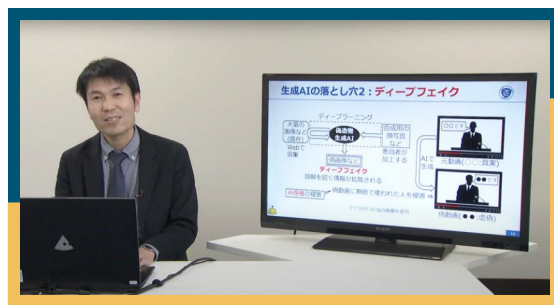
生成AIの落とし穴と回避策