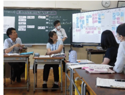
探究的な学習の実現に向けた 授業づくり研修

探究的な学習の実現に向けた授業づくりに関する調査研究（2年次） —「総合的な学習の時間」を通して— 対象校種：小学校