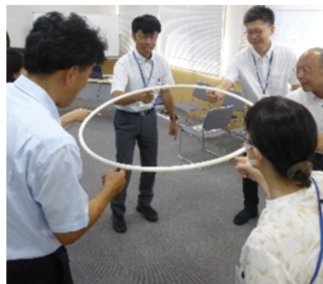
育成プログラム（教員研修）

児童生徒の人間関係の課題に対応した育成プログラムに関する 調査研究（3年次） —教師と児童生徒の相互成長を促す教育相談訪問研修の再編— 対象校種：全校種